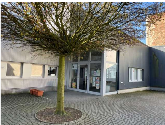
Spichernstraße 11 / bei Bühne11 (parallel zum Rosenplatz)