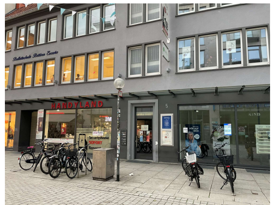
Jürgensort 5 / bei Musikakademie Remelé (gegenüber von Café Extrablatt)